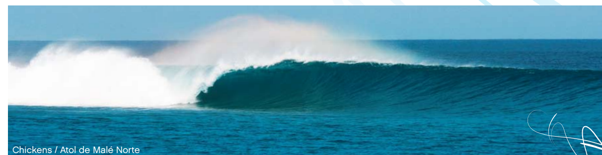
Chickens / Atol de Malé Norte